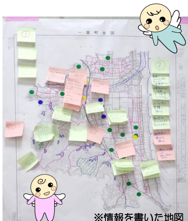
※情報を書いた地図