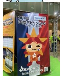
👉 世界大会もある アビリンピック 来年3月には フランスにて開催予定！

技能競技は洋裁や製品パッキング、ビルクリーニングやネイル施術、オフィスアシスタント他、PC プログラミングやデータベース、建築 CAD、電子機器組み立てなどもあり、全25項目。競技の様子は YouTube でも生配信され、全国からの応援を背に戦っていました。視覚障害者のみのパソコン操作競技では Word 文書の書式を整えたり、Excel データと連携づけたり… みんなのすごい技術を前に感動！もっとみんなにも知らせたい～！