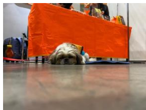
👉 聴導犬としてろう ご夫妻と一緒に来てい たワンちゃん♡あまりに かわいくてパチリ