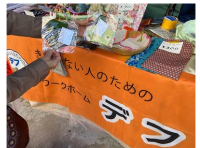
アイデアグッズに出会い つつい衝動買い(^^)♡

3階の多目的ホールでは、「新しい手話の紹介」が時間帯ごとに 開催され、全日本ろうあ連盟作成のハンドブックをもとに、手話 を楽しく学びました。「対立」と「対決」の違い？「争う」と「言い争 う」の違い？さらに「戦争」と「紛争」など、講師の表現はとても分 かりやすく勉強になりました。また、2025年のデフリンピック に向けて、国際手話も少しだけ教えて頂きワクワクしました♡