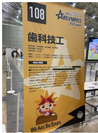
👉 聞こえない人が 主に参加されていた競技は 歯科技工技術