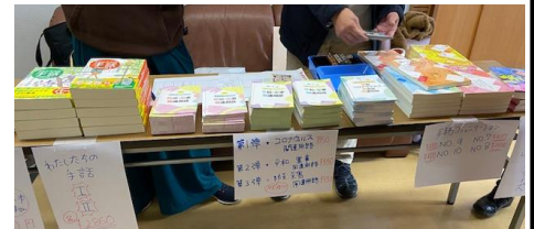
こちらの書籍はセンターで購入可能♡