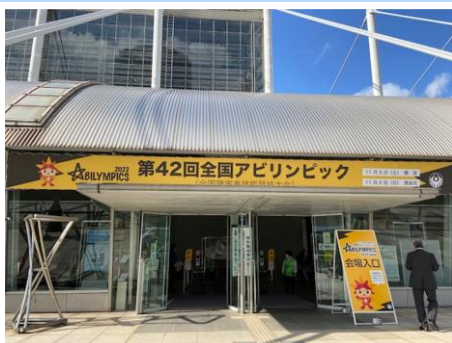
👉 第42回目の今年は11/4～6 千葉幕張メッセで開催

障害のある方々が日ごろ培った技能を競い合う大会です。職業能力の向上を図りつつ、社会一般の障害者雇用に対する理解を深めて、雇用促進を目的に毎年開催されています。正式名称『全国障害者技能競技大会』は、1972年からの歴史ある大会！今年は千葉で開催と聞いて、覗いてきました♡