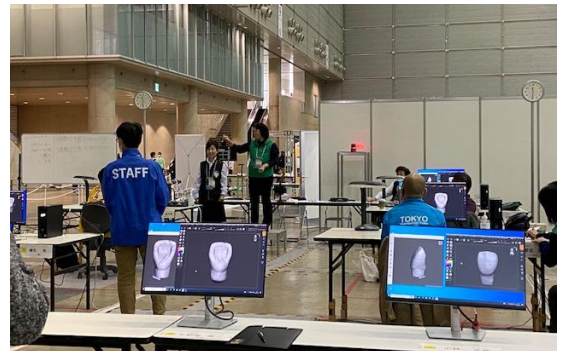
👉 前大会までは文字通り 実物を形成する技術を競っていましたが 今大会からはPCによるカービング技術 を競いました ※カービング=彫刻