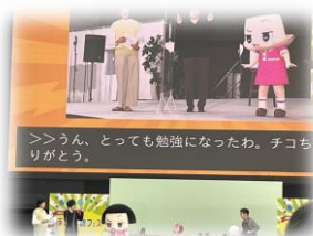
>>>うん、とっても勉強になったわ。チコちゃん、ありがと。