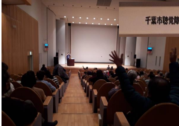
千葉市聴覚障害者協会 創立60周年記念大会

1月22(日)午前、千葉市聴覚障害者協会60周年記念行事と、午後からは「咲む(えむ)」の上映