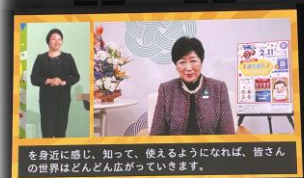
を身近に感じ、知って、使えるようになれば、皆さんの世界はどん広がりしていきます。